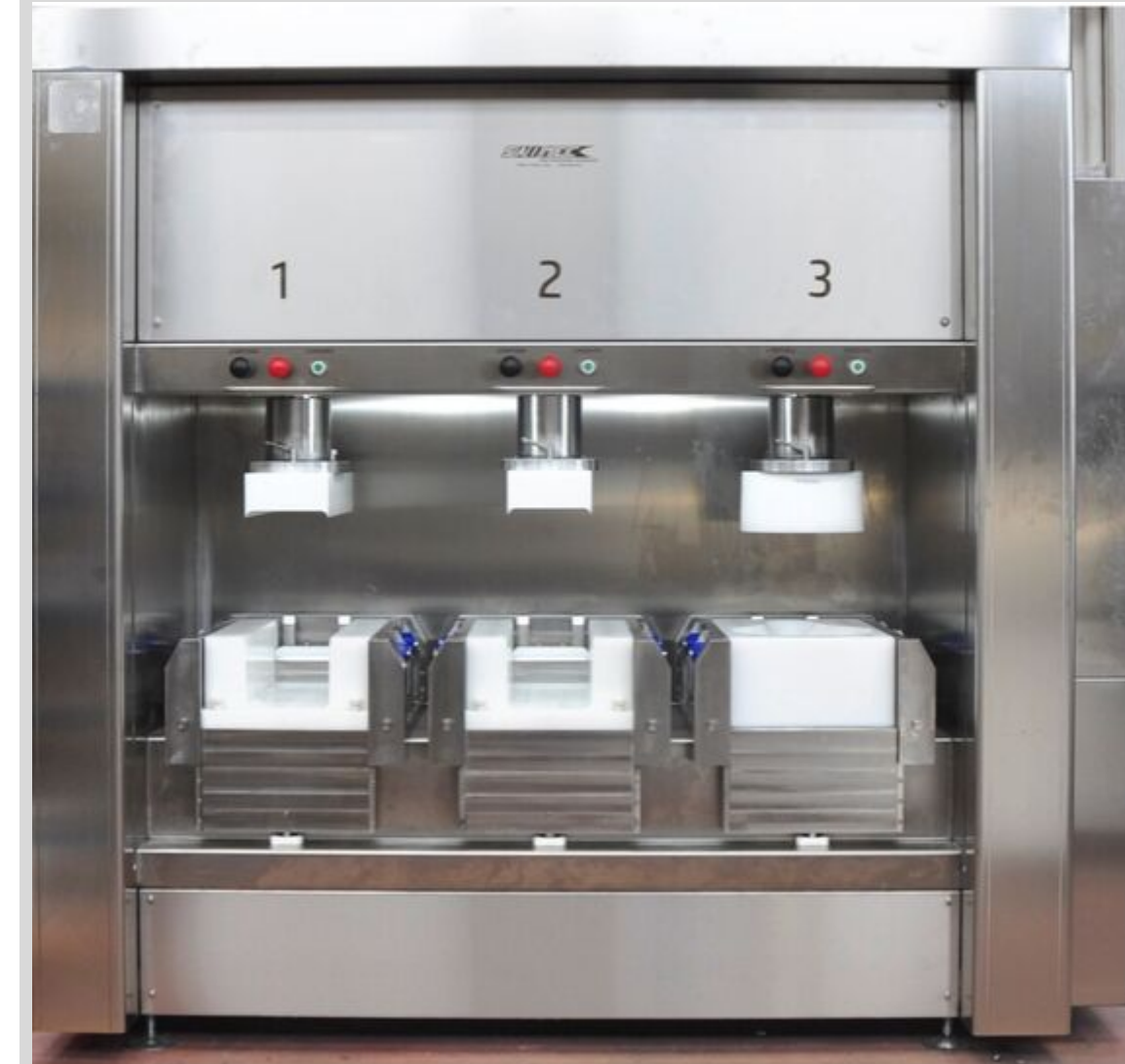
CONFIGURACIÓN A ELECCIÓN

Máquina automática de 2 o 3 posiciones de prensado para jamón deshuesado o similar.